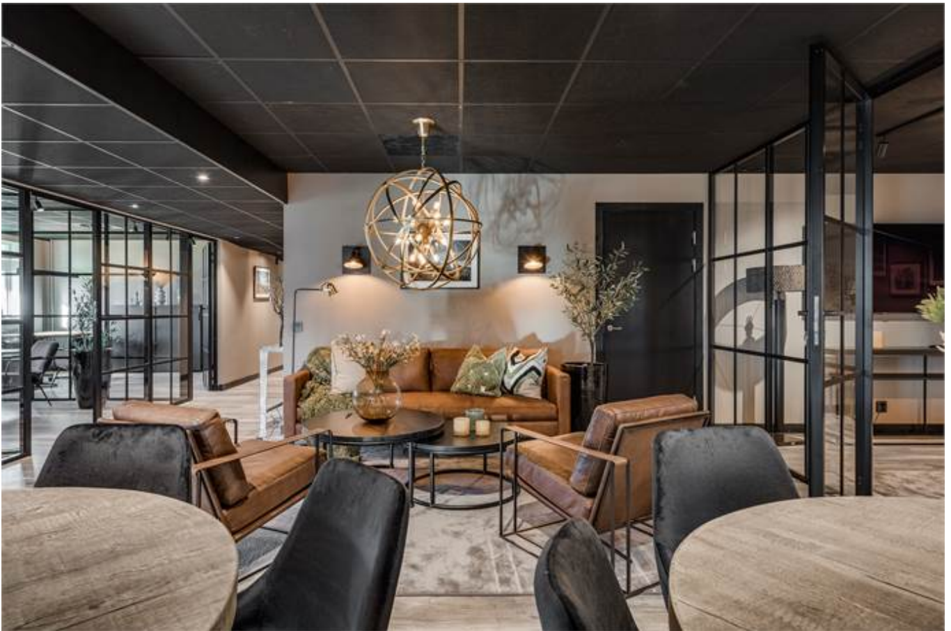
Örbyvägen 18, bottenplan, Skene -