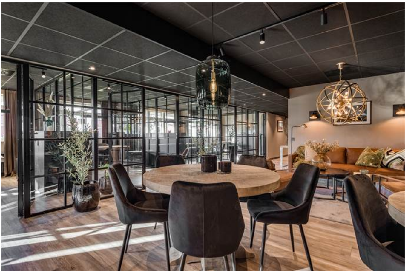
Örbyvägen 18, bottenplan, Skene -