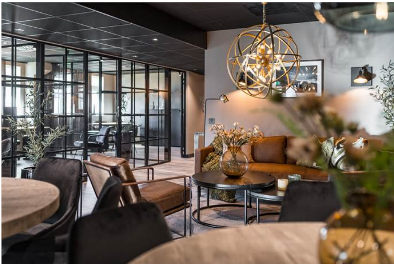
Örbyvägen 18, bottenplan, Skene -