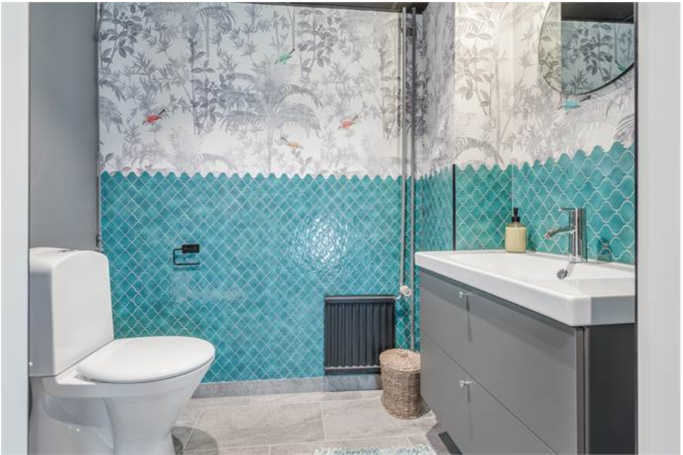
Örbyvägen 18, bottenplan, Skene -