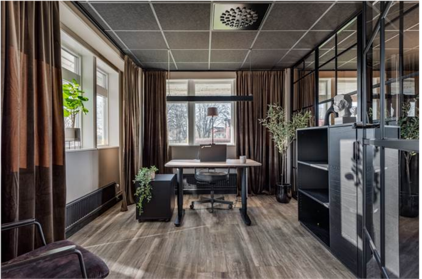
Örbyvägen 18, bottenplan, Skene -