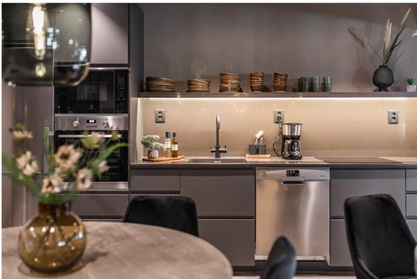
Örbyvägen 18, bottenplan, Skene -