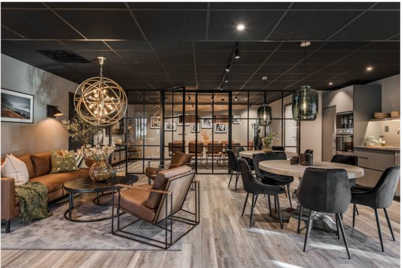
Örbyvägen 18, bottenplan, Skene -