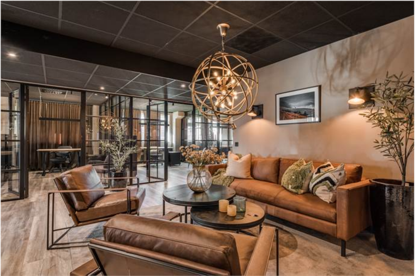
Örbyvägen 18, bottenplan, Skene -