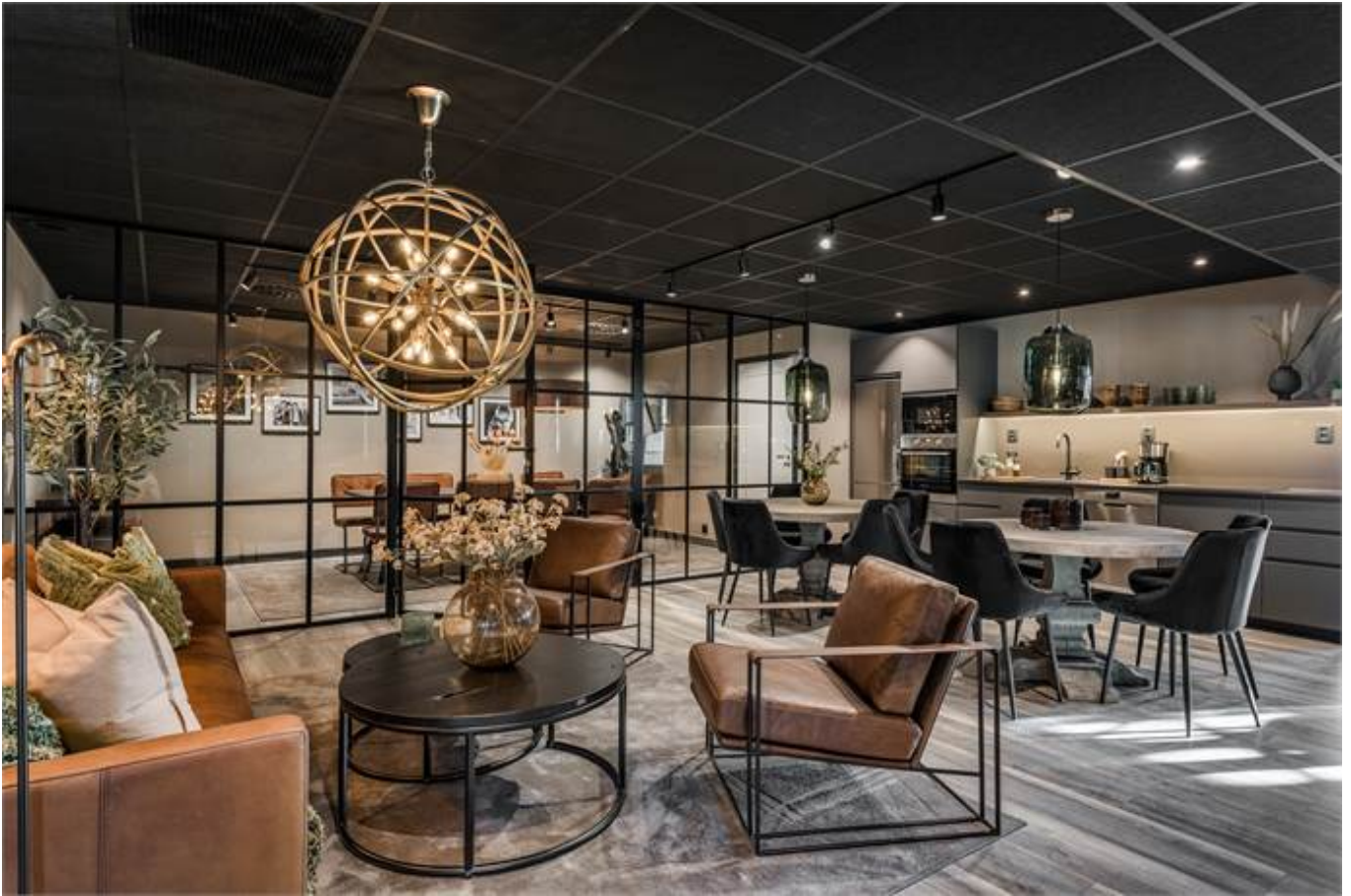
Örbyvägen 18, bottenplan, Skene -