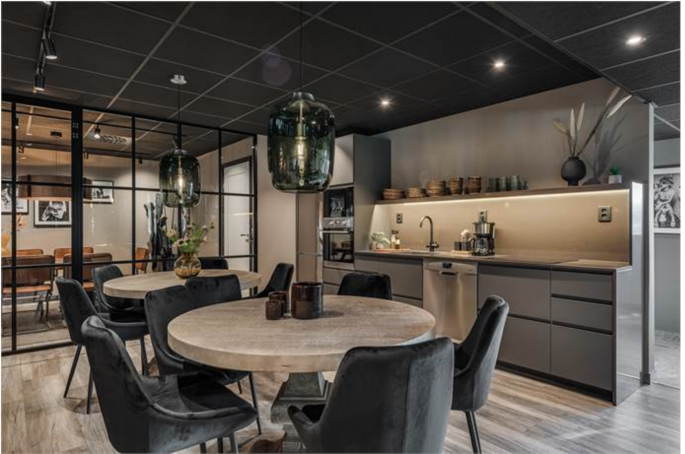
Örbyvägen 18, bottenplan, Skene -