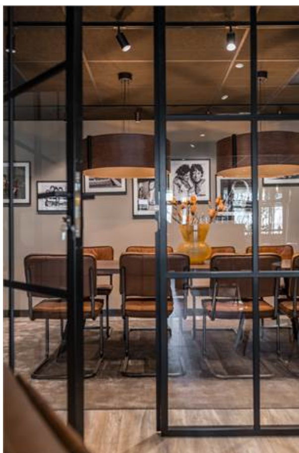
Örbyvägen 18, bottenplan, Skene -