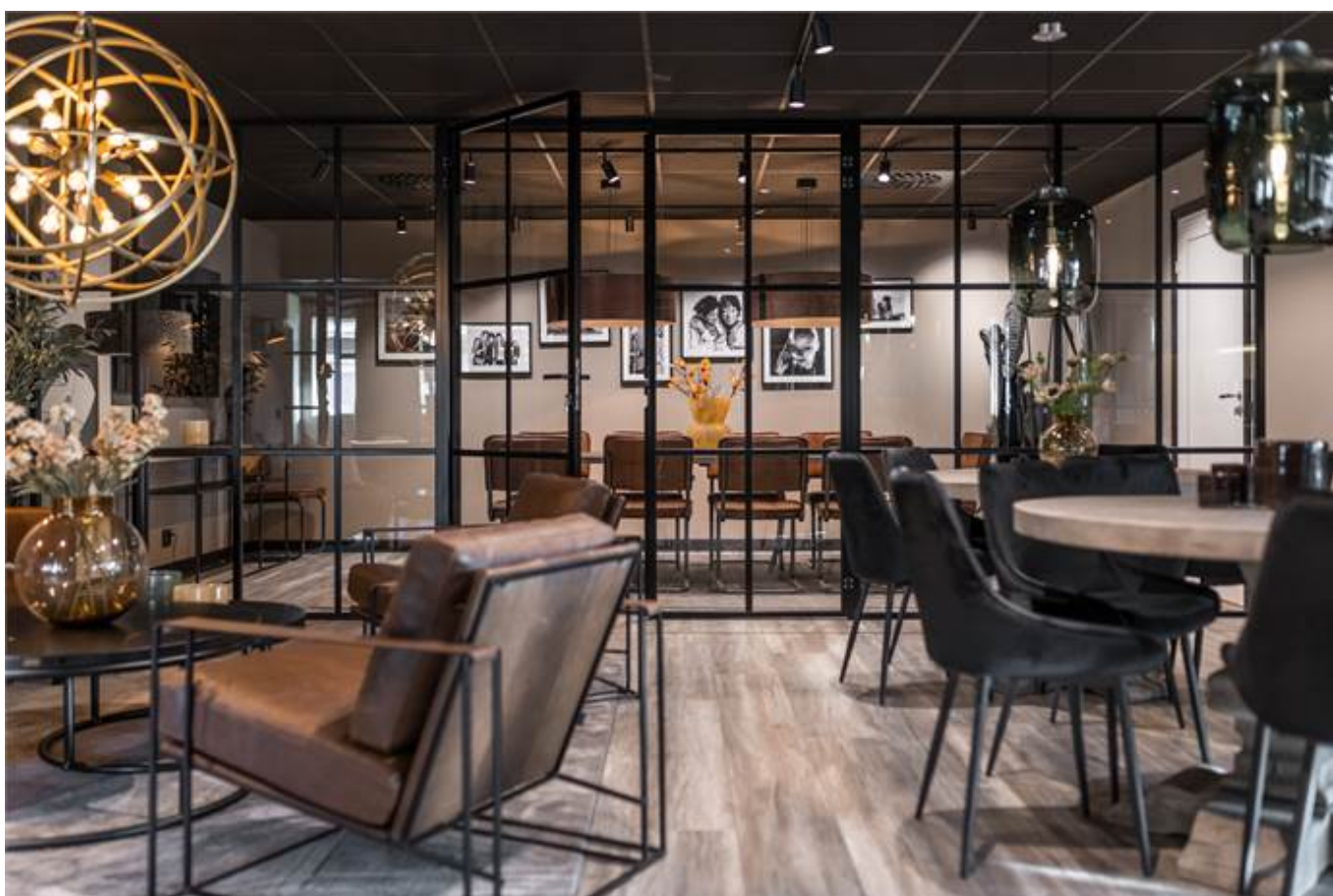
Örbyvägen 18, bottenplan, Skene -