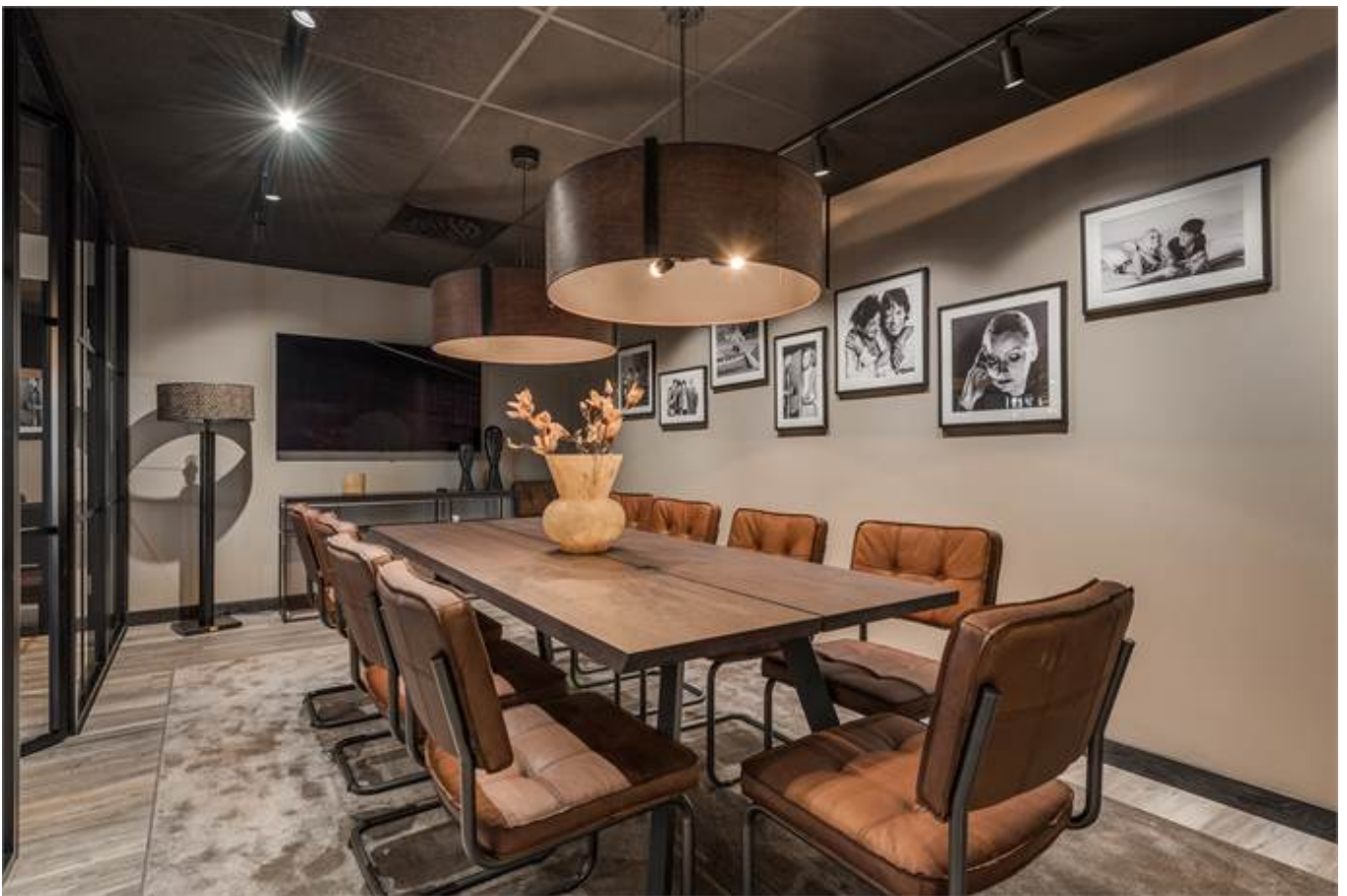
Örbyvägen 18, bottenplan, Skene -