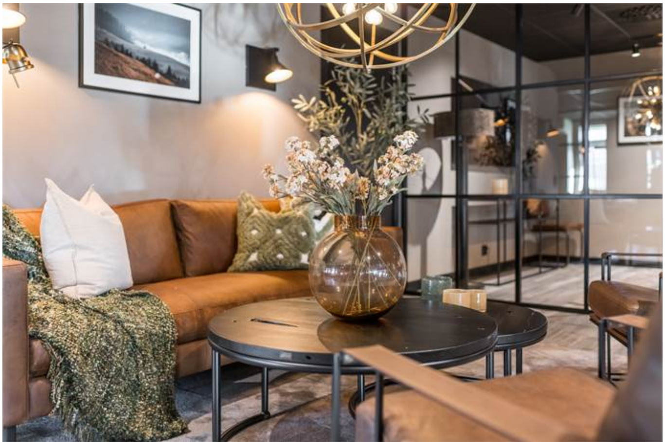
Örbyvägen 18, bottenplan, Skene -