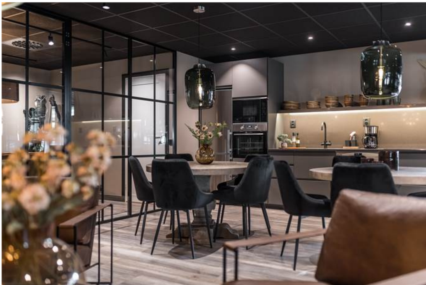
Örbyvägen 18, bottenplan, Skene -