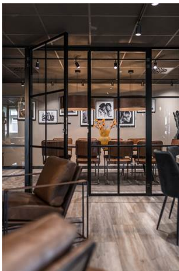
Örbyvägen 18, bottenplan, Skene -